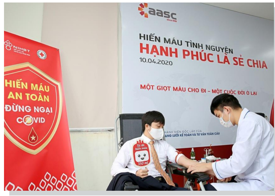
Các tình nguyện viên đến từ cán bộ, nhân viên Công ty AASC tham gia hiến máu