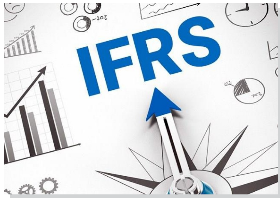
Ảnh minh họa – nguồn Internet

Bộ Tài chính vừa có Quyết định 345/QĐ-BTC ngày 16/03/2020 phê duyệt Đề án áp dụng chuẩn mực báo cáo tài chính tại Việt Nam, với mục tiêu và lộ trình áp dụng như sau: