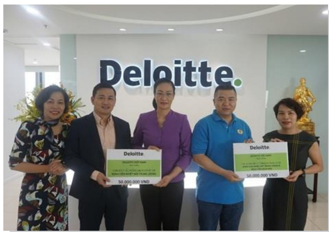
Đại diện của Deloitte Việt Nam trao tặng các phần quà tới Công đoàn Bộ Y Tế Việt Nam tại văn phòng Deloitte Việt Nam

Để chung tay, tiếp sức cho những “chiến sỹ áo trắng”, sáng ngày 26/03/2020, Deloitte Việt Nam đã trao tặng 100 triệu đồng cho Bệnh viện Bệnh Nhiệt đới Trung ương và Bệnh viện Bạch Mai, để gửi tặng 5 cán bộ y, bác sỹ và nhân viên y tế đang bị nhiễm Covid 19, cùng tập thể y, bác sỹ của Bệnh viện Bệnh Nhiệt đới Trung ương đang ngày đêm kiên trì và dũng cảm làm nhiệm vụ.