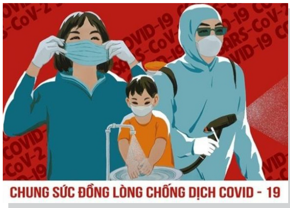
CHUNG SỨC ĐỒNG LÒNG CHỐNG DỊCH COVID - 19

Để có thêm động lực và nguồn lực giúp đội ngũ cán bộ, y bác sĩ đang ngày đêm thực hiện nhiệm vụ phòng, chống dịch Covid-19, cán bộ, nhân viên của Hội Kiểm toán viên hành nghề Việt Nam (VACPA) đã ủng hộ một ngày lương để chung tay, góp sức phòng, chống dịch.